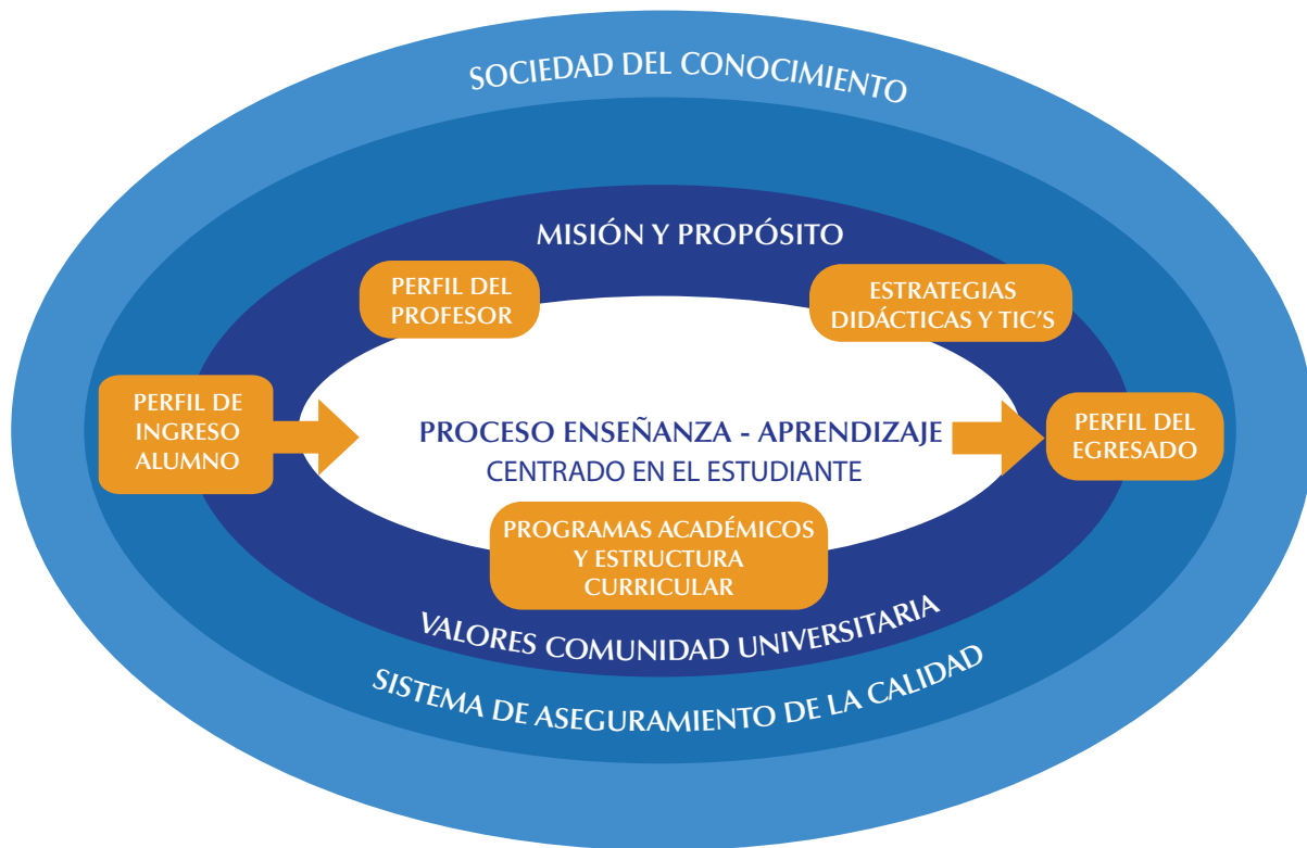
Figura 1. Componentes del Modelo Educativo Institucional (2011)